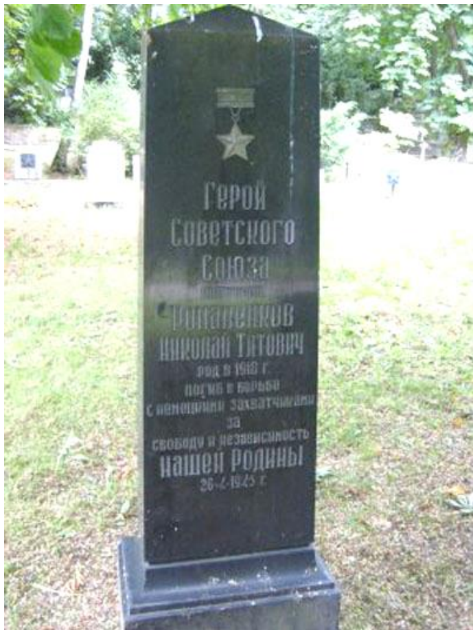
Памятник Н.Т.Романенкову на воинском кладбище города Познань.

Двенадцать самоходных орудий и несколько подразделений автоматчиков атаковали поредевший в бою батальон. Первый натиск врага был отбит с большими для него потерями, но к гитлеровцам непрерывно прибывали подкрепления и с ходу вступали в бой. Несколько раз автоматчики врываются в наши траншеи, но бойцы уничтожали их.