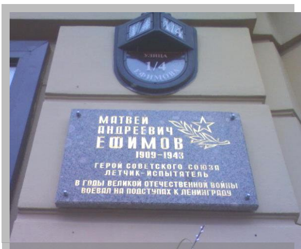
Памятная доска на улице им. М.А.Ефимова в Санкт-Петербурге.