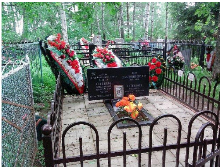
Могилы К.Н.Титенкова на Никольском кладбище.

Патриотический интернет-проект «Герои страны» // http://www.warheroes.ru