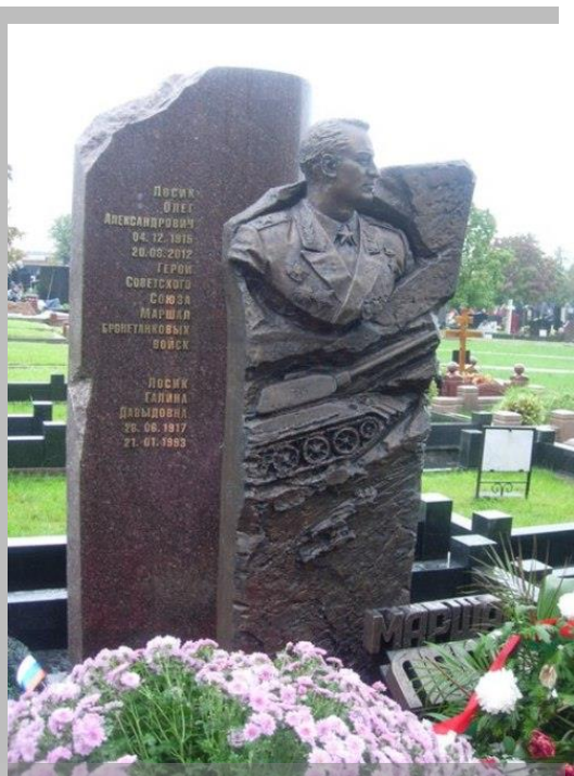
Памятник на могиле О.А.Лосика

Умер О.А. Лосик 20 августа 2012 года. Похоронен на Троекуровском кладбище в Москве.