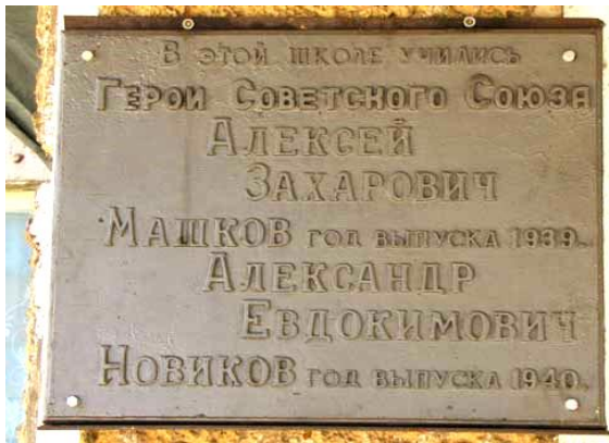
Мемориальная доска на здании средней школы № 1 г. Ярцева