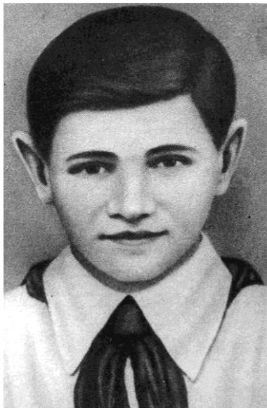
Валя Котик – самый юный Герой Советского Союза

Звание Героя Советского Союза впервые было присвоено 20 апреля 1934 года отважным советским лётчикам Михаилу Водопьянову, Ивану Доронину, Николаю Каманину, Сигизмунду Леваневскому, Анатолию Ляпидевскому, Василию Молокову и Маврикию Слепневу за спасение со льдины в Чукотском море членов арктической экспедиции и экипажа ледокола «Челюскин».